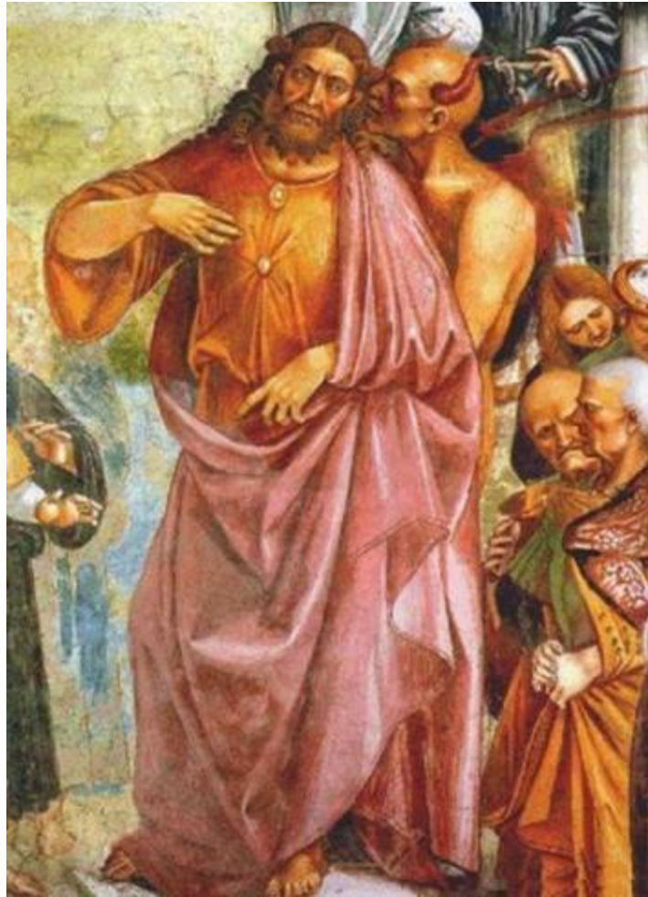
Le Jugement dernier-épisode de la venue de l'Antéchrist. [116]